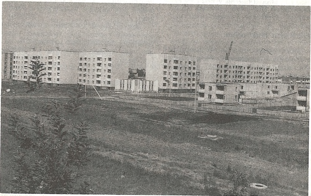
Бёска Козенкі. Новая вуліца