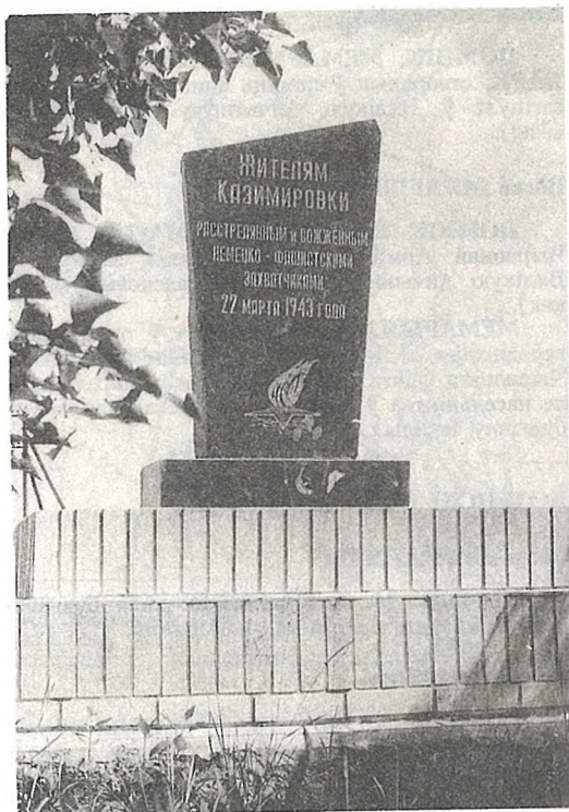
Помнік жыхарам в. Казіміраўка

ПОМНІК АХВЯРАМ ФАШЫЗМУ — мірным жыхарам вёскі, якія закатаваны 22.3.1943 г. (на заходняй ускраіне).