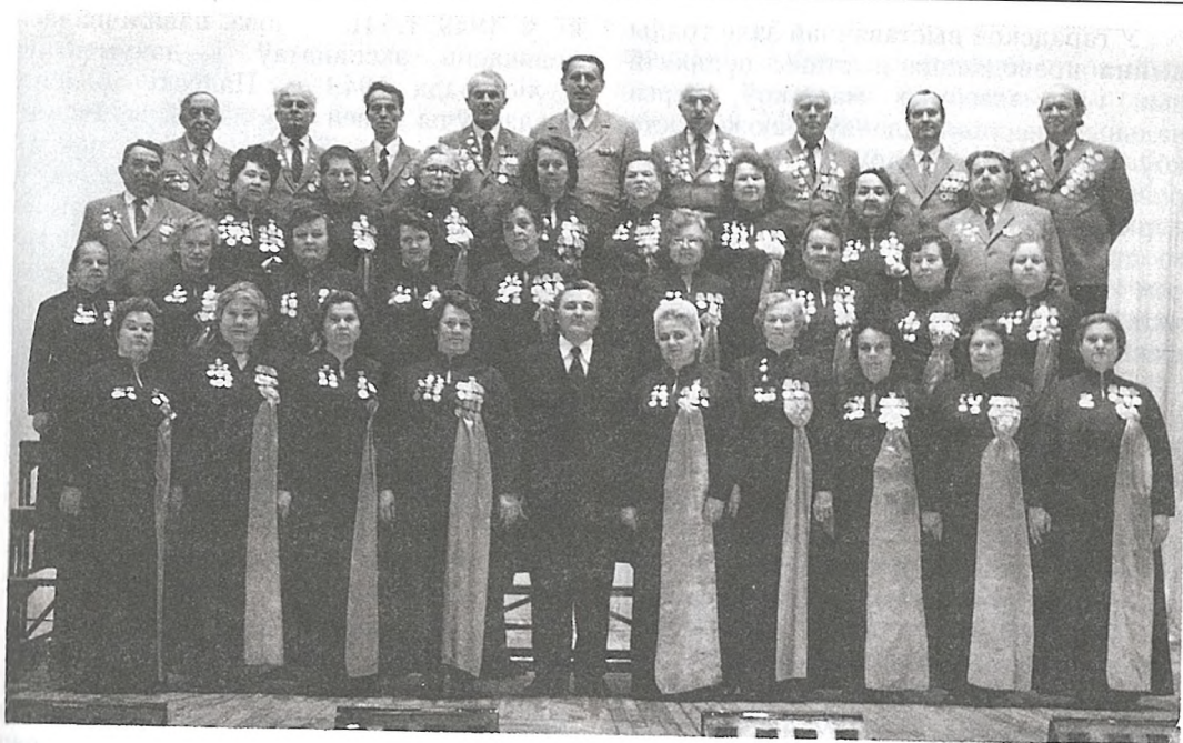
Хор ветэранаў Мазыра