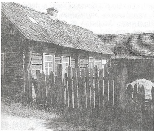
Хата, пакрытая чаротам у пачатку ХХ ст. у в. Малы Бакавец

Гара Камунараў — гістарычнае месца, запаведнае ў Мазыры, адсюль браў пачатак горад. Экспазіцыя музея разглядаецца ў двух вялікіх раздзелах: «Гісторыя дасавецкага перыяду» і «Прырода нашага краю». Прадстаўлены ўзоры жаночых упрыгожанняў — бранзалеты са шкла і фібула (бронзавы век), амфара другой паловы XII ст., калаўрот XII — XIII стст., узоры кафляных плітак, гліняны посуд XVI — XVIII стст. Сярод экспанатаў — калекцыі мінералаў і горных парод, насякомых, чучалы птушак і зьяроў, вялікі гербарый.