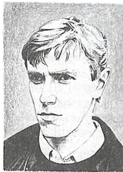
У сны прыходзіць Радзіма