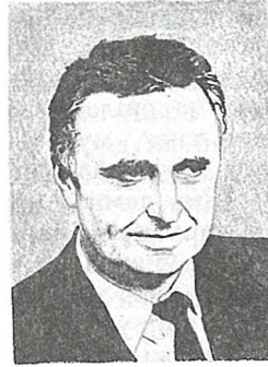
Натхня родны кут...

Мазыру, Прыпяці прысвечаны многія творы беларускіх пісьменнікаў, чыя жыццёвая або працоўная біяграфія звязана з гэтым палескім краем.