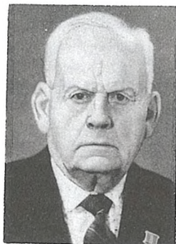
А. П. Эльман

та, з 1940 г. — сакратар Гомельскага, Беластоцкага, Новасібірскага, Гродзенскага абкамаў КПБ. У 1948 г. — намеснік старшыні Савета Міністраў БССР. У 1949—1952 гг. — намеснік старшыні Палескага аблвыканкама, у 1952—1968 гг. — дырэктар, рэктар Мазырскага педагагічнага інстытута. У сувязі з 90-годдзем з дня нараджэння А. П. Эльману прысвоена званне ганаровага грамадзяніна Мазыра.