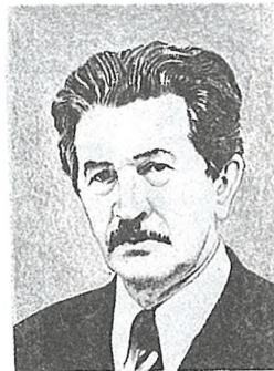
За ціхай цёплай рэчкай

Прокша Леанід Януаравіч (н. у 1912 г.) — беларускі і рускі пісьменнік. У 1955 г. скончыў ваенна-палітычную акадэмію. У 30-я гады працаваў настаўнікам на Мазыршчыне (в. Кустаўніца), з 1937 г. — у рэдакцыях газет і часопісаў. Друкуецца з 1937 г. Аўтар зборнікаў памфлетаў «Інтрыгі прэзідэнцкага двара», «Візітная картка народа», гумарыстычных апавяданняў «Не ў тым поездзе».