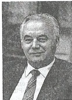
А. А. Малафееў

У 1971—1975 гадах Анатоль Аляксандравіч Малафееў быў першым сакратаром Мазырскага гаркама Кампартыі Беларусі. У гэты перыяд асабліва інтэнсіўна рос і развіваўся горад: было пабудавана шмат жылля, школ, узведзена новая бальніца, уступіла ў строй дзеючых першая чарга Мазырскага нафтапрацоўчага завода. У працоўныя дасягненні мазыран вялікі ўклад унёс Анатоль Аляксандравіч, таленавіты арганізатар, чулы партыйны кіраўнік.