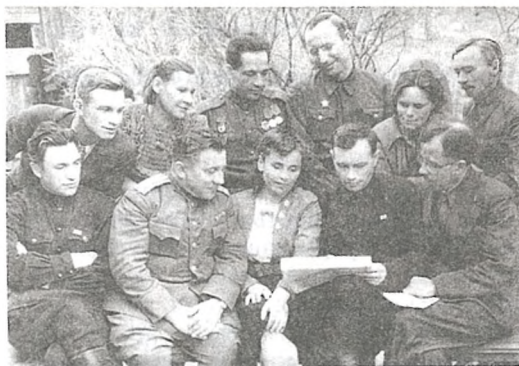
Дэлегацыя з Ульянаўска. 1944

1944 года рабочыя прамысловай арцелі «Молат» прыступілі да выканання важнага задання: у тэрміновым парадку трэба было даць насельніцтву Мазыра і раёна 900 вэдзер і 400 леек.