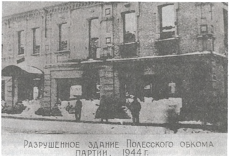
Руіны будынка Палескага абкама партыі. 1944

Праз два тыдні пасля вызвалення Мазыра ў горадзе была адноўлена гарадская электрастанцыя. Яшчэ раней аднавіў работу хлебазавод. Праз 20 дзён пачаў працаваць водаправод. Хутка была адноўлена і фабрыка індывідуальнага пашыву, якая да 1 студзеня 1945 г. дала прадукцыі больш чым на мільён рублёў у тагачасных цэнах. 23 студзеня