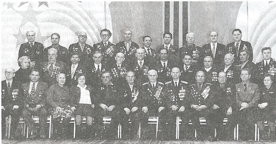
Ветэраны 15-й гвардзейскай кавалерыйскай дывізіі — удзельнікі вызвалення Мазыршчыны на сустрэчы ў 1994 г. у Мазыры

Да 2.00 14 студзеня асноўная частка горада была вызвалена. Поўнасю Мазыр вызвалены да 6 гадзін раніцы. У вызваленні Мазыра актыўны ўдзел прымала і Мазырская партызанская брыгада пад камандаваннем А. Л. Жыльскага.