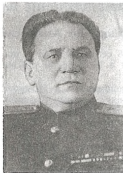
І. Д. Ветраў

Ветраў Іван Дзмітрыевіч (н. у 1905) перад вайной працаваў пракурорам Беларускай ССР, быў членам ЦК КП(б)Б і дэпутатам Вярхоўнага Савета БССР першага склікання. Пасля акупацыі фашысцкімі захопнікамі Беларусі пайшоў на фронт, удзельнічаў у абароне Масквы. У канцы 1941 г. быў накіраваны ў распараджэнне ЦК КП(б)Б, выконваў заданні Беларускага штаба партызанскага руху. Са жніўня 1943 г. і да вызвалення Палесся быў першым сакратаром Палескага падпольнага абкама партыі і камандзірам злучэння партызанскіх атрадаў гэтай жа вобласці. Аўтар кнігі «Братыя по оружию». Узнагароджаны ордэнамі Леніна, Чырвонага Сцяга, Айчыннай вайны, многімі медалямі.