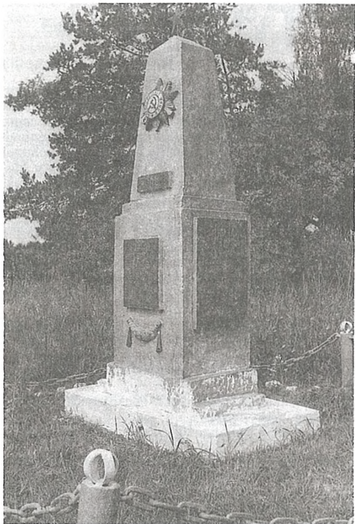
Помнік на месцы разгрому партызанамі нямецкага гарнізона ў в. Шчакатава