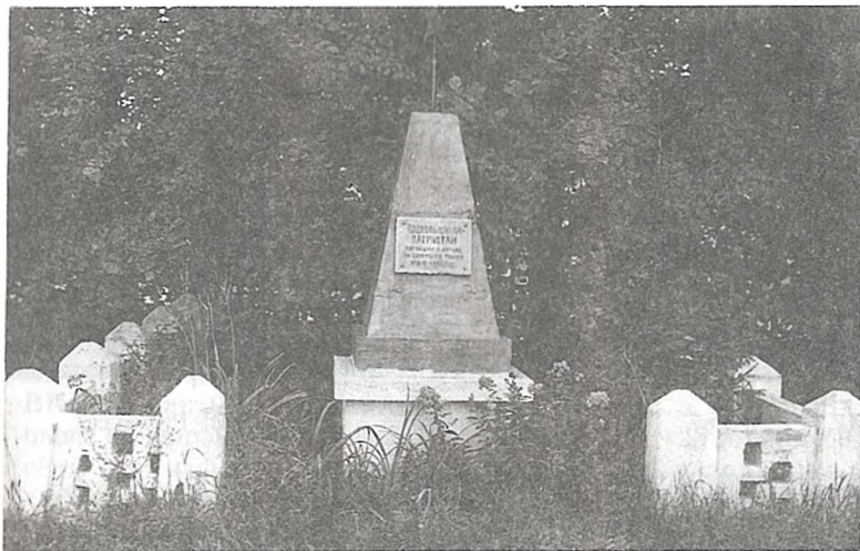
Помнік загінуўшым падпольшчыкам (у двары СШ № 4 г. Мазыр)

КАРПАЎ Іван Якаўлевіч , н. у 1915, інструктар упраўлення міліцыі Палескай вобласці, расстраляны ў лістападзе 1941.