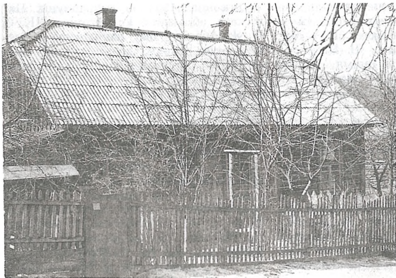
Дом на вул. Калініна, 6, дзе была явачная кватэра падпольшчыкаў

«У тую ліпеньскую ноч, — успамінае жонка падпольшчыка Соф'я Ніканораўна Абрамава, — муж доўга размаўляў у кватэры з падпольшчыкам Смародскім, які падтрымліваў сувязь з партызанамі. Я, як заўсёды, знаходзілася ў двары і назірала. Смародскі пайшоў. Праз пяць мінут да дома пад'ехала грузавая машына з эсэсаўцамі. Яны акру-