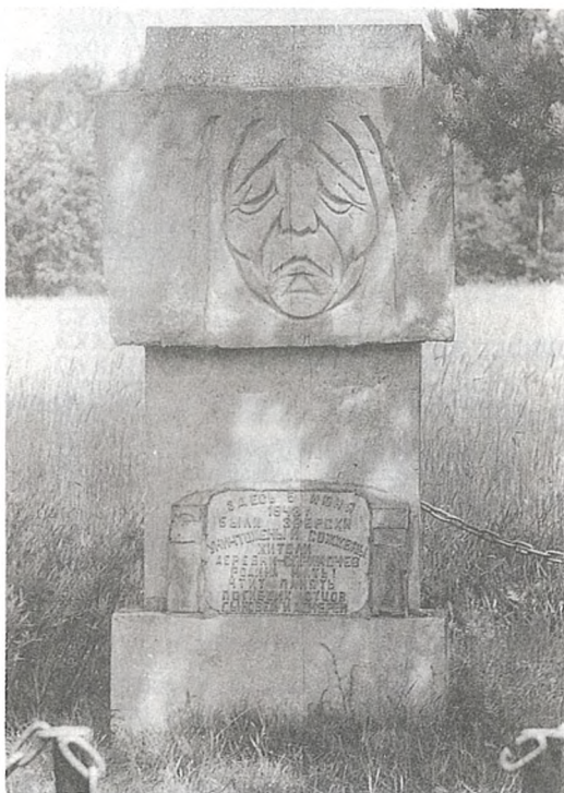
Помнiк жыхарам в. Спрымачоў і навакольных вёсак, спаленым жывымі ў Спрымачове