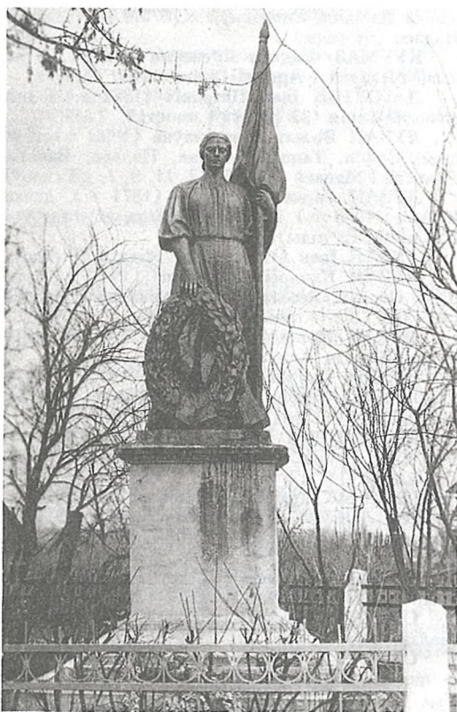
Помнік жыхарам в. Касцюковічы, закатаваным у 1943 г.

ТУРБАЛ Марына Іванаўна (1901 г.) і яе дзеці Іван і Марыя (6 і 4 гады)