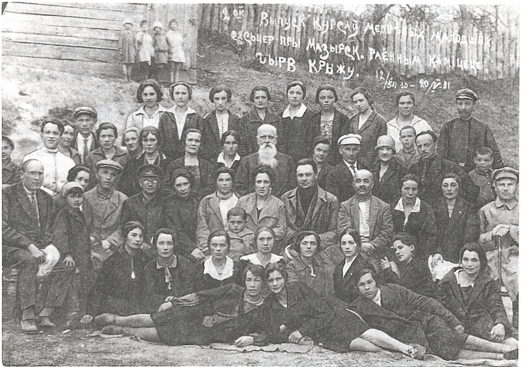
Выпуск курсу малодшых медыцынскіх сяцёр пры Мазырскім раённым камітэце Чырвонага Крыжа. 1931

цавала 25 чалавек, арцель «Молат» — 56, цагельны завод — 34, Белхімлес — 104, цагельная арцель «Будаўнік» — 31, лесапільны завод «Пралетарый» — 301, фанерны завод «Чырвоны Кастрычнік» (былы «Прыма») — 427, шавецкія арцелі «Уперад» — 61 і «Чырвоны саматужнік» — 81, дрэваапрацоўчая фабрыка «Прафінтэрн» — 259 чалавек.