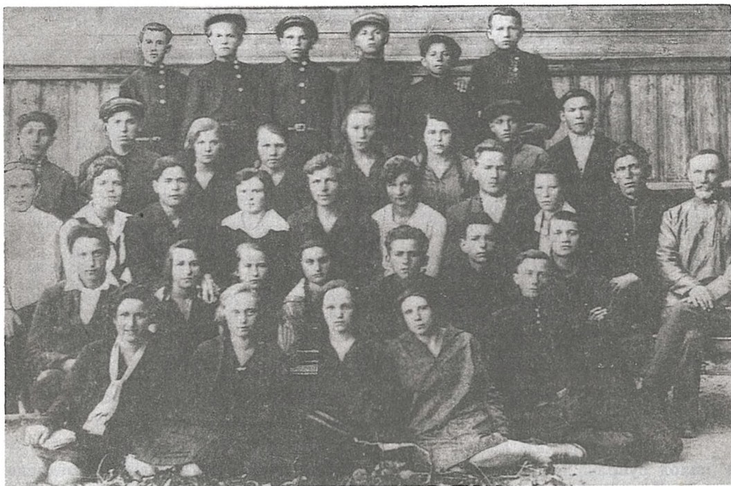
Выпуск Слабадской школы. 1931

Працавалі школы ў вёсках Пянькі, Рэдзька і іншых.