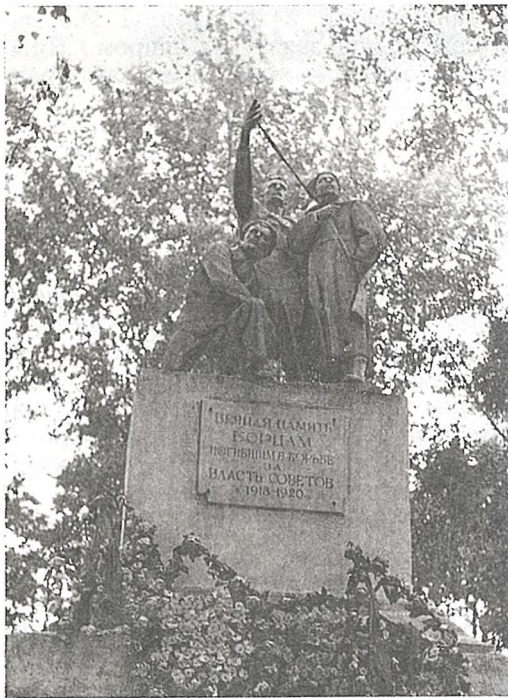
Помнік загінуўшым у грамадзянскай вайне

ланка», падпольшчык г. Мазыр, павешаны белапалякамі ў чэрвені 1920.