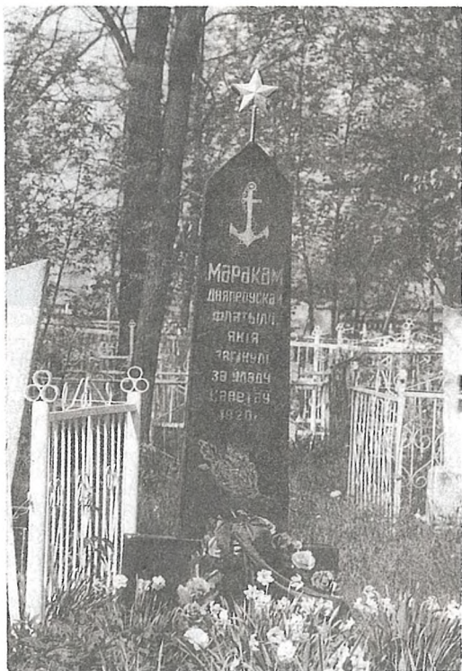
Помнік маракам Дняпроўскай ваеннай флатыліі, якія загінулі ў 1920 г. В. Слабада

палякаў дзейнічала ў цэнтры на Мазыр і Калінкавічы з захаду.