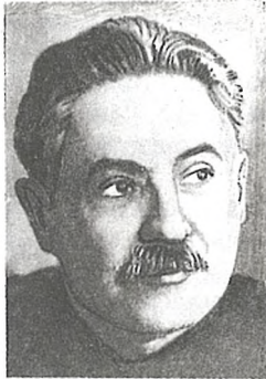
Д. З. Мануільскі

тызанскі атрад, які актыўна ўключыўся ў барацьбу з ворагам.