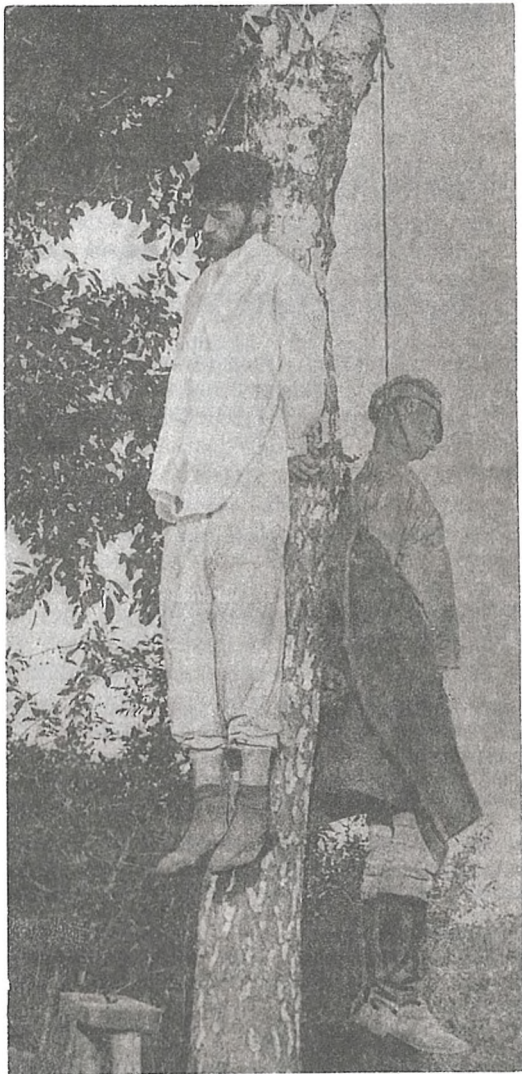
Зверствы польскіх акупантаў. 1920

Філ. Да Гом. вобл. г. Мазыр. Ф. 307. Воп. 1. Спр. 2. Л. 50—51.