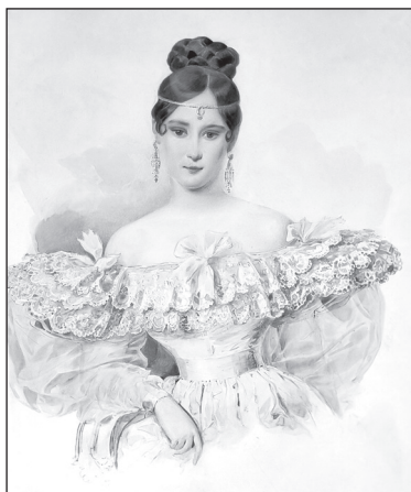
Наталья Николаевна Пушкина (Гончарова). Художник К. Брюллов. 1831–1832 гг.

Примерный ответ. Высокая талия платьев, прямая юбка, корсет, помогающий лучше подчеркнуть силуэт, создавали образ высокой, стройной красавицы античного Рима — таким был костюм в стиле ампир.