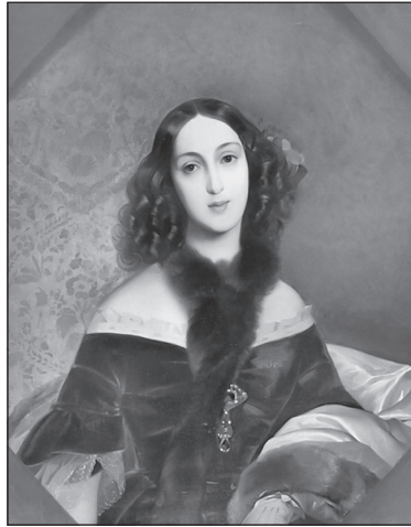
Мария Аркадьевна Бек (Столыпина). Художник К. Брюллов. 1840 г.

ЛИТЕРАТУРОВЕД: А если говорили, что кто-то носит галстук «Вальтер Скотт», это означало, что у него платок в клетку и что модник увлекается историческими романами знаменитого шотландца.