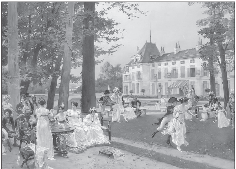
Приём в Мальмезоне в 1802 году. Художник Ф. Фламенг. Около 1894 г.

1. Второй Чадаев, мой Евгений, Боясь ревнивых осуждений, В своей одежде был педант И то, что мы называли фронт.