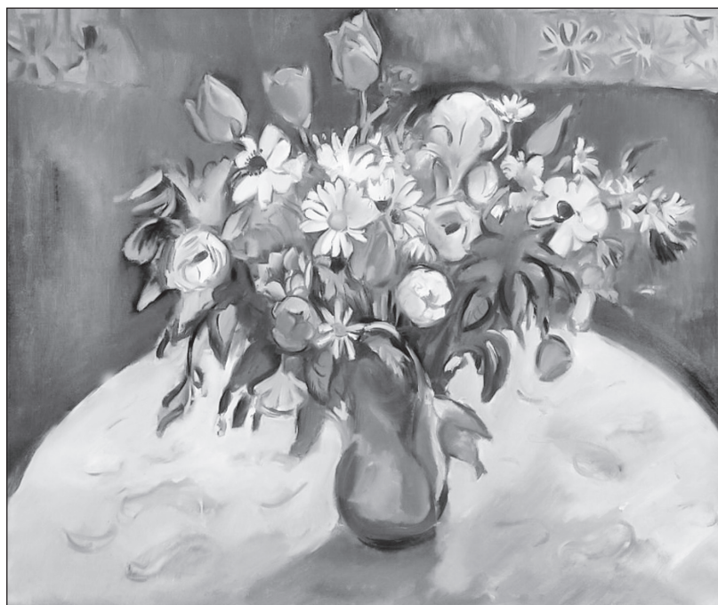
Тюльпаны и маргаритки. Художник Э. Фриез. 1910 г.

ИСТОРИК: Если современные веяния для А.С. Пушкина — это нечто новое, наносное, заимствованное из-за рубежа, то неслучайно поэт противопоставляет им другое понятие-символ — «старина».