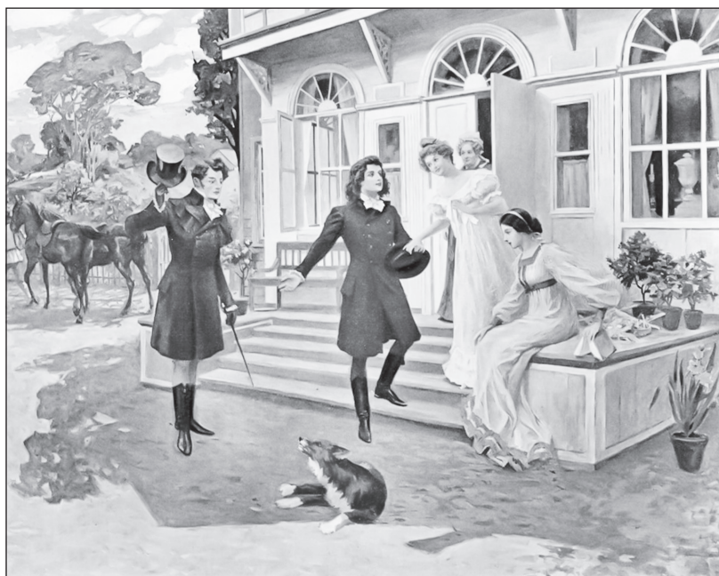
«Явились. Им расточены порой тяжёлые услуги гостеприимной старины...» Художник Е. Самокиш-Судковская. Ранее 1908 г.

Она езжала по работам, Солила на зиму грибы, Вела расходы, брила лбы, Ходила в баню по субботам, Служанок била осердясь — Всё это мужа не спросясь.