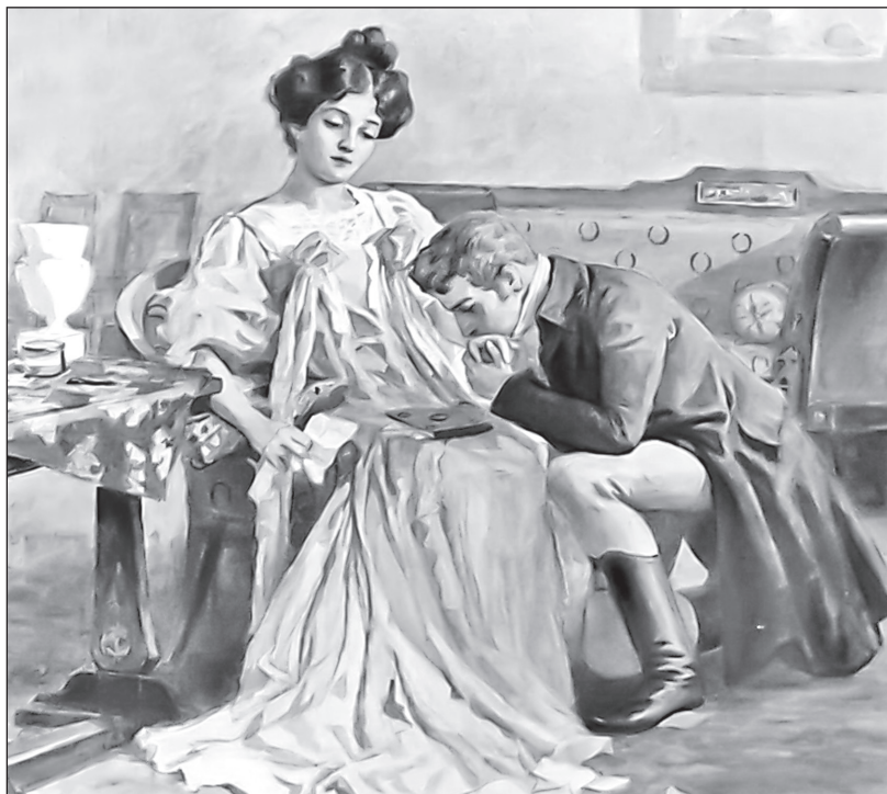
Онегин у ног замужней Татьяны. Художник Е. Самокиш-Судковская. 1908 г.

ЛИТЕРАТУРОВЕД: И Татьяна, ставшая в итоге заложницей моды, тяготеет к ней. Вот что она говорит Евгению в конце романа: