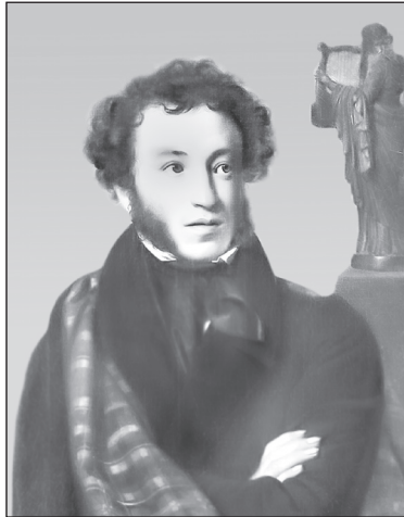
Александр Сергеевич Пушкин. Художник О. Кипренский. 1827 г.

Этим словом во все времена называют кратковременное увлечение значительной части общества какими-либо вещами, книгами, идеями.