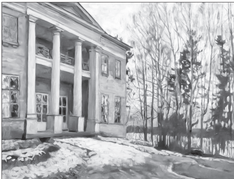
Усадьба. Отблески вечерней зари. Художник С. Жуковский. 1912 г.

ИСТОРИК: Мужчинам, так же как и дамам, было свойственно до-