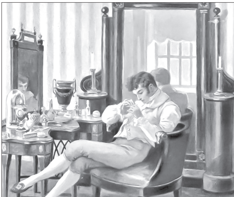
«Быть можно дельным человеком и думать о красе ногтей...» Художник Е. Самокиш-Судковская. Ранее 1908 г.

ЛИТЕРАТУРОВЕД: Многие виды одежды, обуви и головных уборов отошли в прошлое, и их названия уже ничего не говорят нашему во-