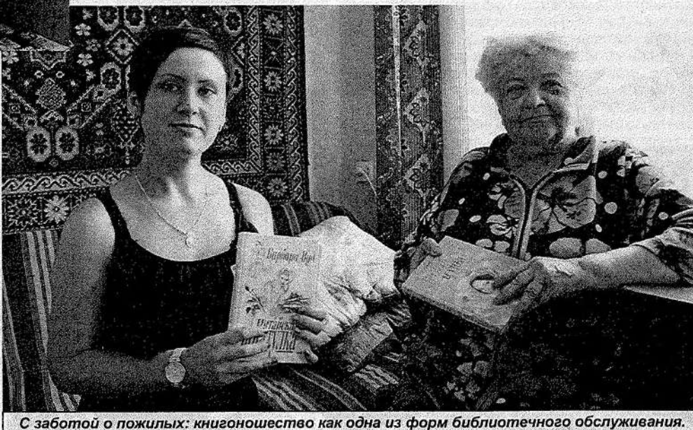
С заботой о пожилых: книгоношество как одна из форм библиотечного обслуживания.

Максимально приближенная к населению сельская библиотека давно уже стала центром общественной и культурной жизни деревни, единственным учреждением, предоставляющим бесплатное пользование книгой. Именно сюда сельские жители идут за свежей газетой, интересным журналом, новой книгой, определенной консультацией, а порой просто за советом